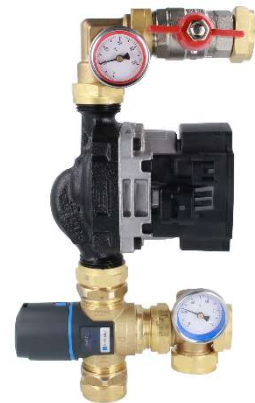
Рис. 1. Смесительный модуль BTU с клапаном АТМ

Смесительный модуль BTU состоит из термостатического смесительного клапана АТМ 561 (1), циркуляционного насоса (2), двух термометров (3), запорного клапана (4) и латунных соединительных элементов. Смесительный модуль BTU должен быть соединен с отопительной установкой на стороне источника тепла с помощью двух гаек GW G1". Мы рекомендуем использовать шаровые запорные клапаны для подключения модуля с установкой. К распределителю модуль также привинчивается с помощью гаек GW G1". Разделители AFRISOBasic уже оснащены комплектом ниппелей с уплотнением для легкого подключения модуля смешения. Во время нормальной работы запорный клапан модуля (4) должен быть открыт, т. е. ручка должна быть расположена вдоль клапана. Клапан можно закрыть, например, для замены циркуляционного насоса.