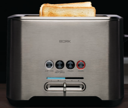
ТОСТЕР T702 РУКОВОДСТВО ПОЛЬЗОВАТЕЛЯ