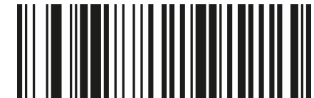
ДОБАВИТЬ СУФФИКС CR+LF