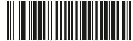
ДОБАВИТЬ СУФФИКС CR