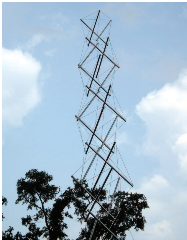
Рис. 0.4. Используя натянутые тросы и металлические распорки, можно создать самонесущие конструкции. Целостность этой конструкции определяется взаимодействием элементов сжатия и натяжения. Как отмечает Снельсон, если в простой структуре разрушение одного элемента может привести к разрушению всей структуры, в более сложных конструкциях подобный вызов в одной из ее областей приведет к менее катастрофическим последствиям (подробнее об этом — на его веб-сайте http://kennethnelson.net/faq ). Мы снова вернемся к этому, когда будем рассматривать тело и то, как оно может адаптироваться к дисфункции в какой-либо из его областей

Вплоть до XX века ученые придерживались преимущественно картезианского подхода к восприятию тела, концентрируясь на его частях и поддерживая образ тела, работающего по принципу архитектурной машины. Подобный взгляд не оспаривался вплоть до 1948 года, когда скульптор Кеннет Снельсон создал серию структур, неумышленно имитировавших взаимодействие между костями и миофасцией тела (см. рис. 0.4). Снельсон, обучавшийся у философа и архитектора Бакминстера Фуллера, использовал натянутые провода для обеспечения поддержки прочным компрессионным распоркам. Фуллер продолжил развивать эти идеи и геометрию того, что он впоследствии назвал структурами тенсегрити, используя их в качестве моделей для элементов естественного мира, начиная от атома до человечества и Вселенной в целом (интересный отголосок стремлений более ранних натурфилософов