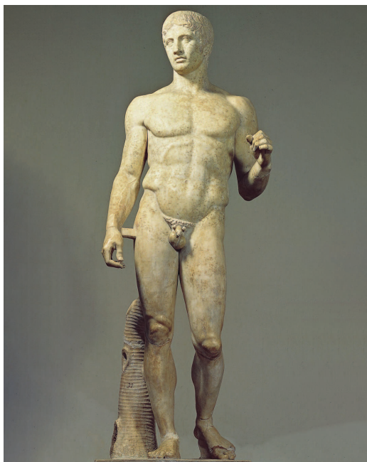
Рис. 0.2. Статуя копыеносца была первоначально создана Поликлетом в 450–400 гг. до н. э. Она являлась примером идеальных пропорций человека, на который ссылались многие, в том числе Гален, чрезвычайно влиятельный врач, живший 600 лет спустя, а также Витрувий и, наконец, да Винчи

Рисуя Витрувианского человека, да Винчи хотел продемонстрировать свое совершенное владение анатомией и понимание божественного начала, а также свою искусность в механике и архитектуре. Поместив человеческую форму внутри круга и квадрата, он тем самым демонстрировал соотношение божественного и земного в теле, а небольшое смещение круга вверх позволило пупку стать как геометрическим, так и физиологическим центром (см. также рис. 0.2). Однако он использовал инструменты того времени: угольник и компас. Тем самым Леонардо заложил первый камень недопонимания анатомии в современном мире, определив геометрическое совершенство анатомии, основанное на инструментах и методах строительства XV века.