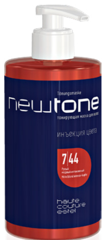
ТОНИРУЮЩАЯ МАСКА ДЛЯ ВОЛОС NEWTONE ESTEL HAUTE COUTURE 7|44 РУСЫЙ МЕДНЫЙ ИНТЕНСИВНЫЙ 435 мл арт. NT7/44

Следите за уникальной игрой цвета и света на волосах. Огненные искры вспыхивают и тают на медном полотне, оживляя цвет и притягивая взгляды.