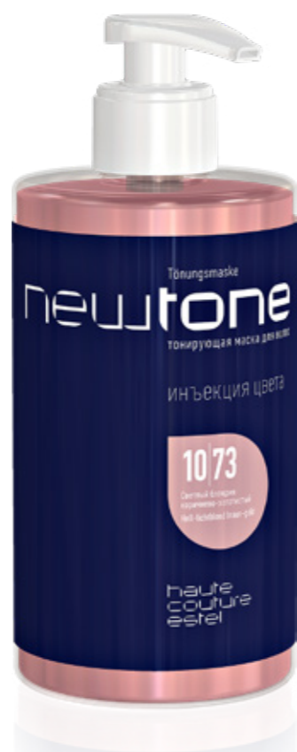
ТОНИРУЮЩАЯ МАСКА ДЛЯ ВОЛОС NEWTONE ESTEL HAUTE COUTURE 10|73 СВЕТЛЫЙ БЛОНДИН КОРИЧНЕВО-ЗОЛОТИСТЫЙ 435 мл арт. NT10/73

Натуральный и сияющий оттенок блонд, по-разному раскрываясь на волосах, как нельзя лучше выражает индивидуальность и позитивное отношение к миру. Создайте тёплый, изысканный беж с помощью NEWTONE.