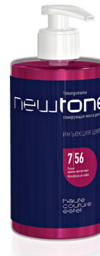
ТОНИРУЮЩАЯ МАСКА ДЛЯ ВОЛОС NEWTONE ESTEL HAUTE COUTURE 7|56 РУСЫЙ КРАСНО-ФИОЛЕТОВЫЙ 435 мл арт. NT7/56

Наполните цвет невероятной яркостью, превратив красный — в страстный. Уникальный оттенок создан для того, чтобы покорять.