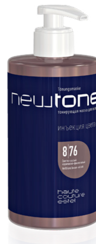
ТОНИРУЮЩАЯ МАСКА ДЛЯ ВОЛОС NEWTONE ESTEL HAUTE COUTURE 8|76 СВЕТЛО-РУСЫЙ КОРИЧНЕВО-ФИОЛЕТОВЫЙ 435 мл арт. NT8/76

Сочетание тёплых и холодных нюансов раскрывается на волосах богатством цвета. Природная натуральность оттенка идеально дополнит образ вашего клиента.