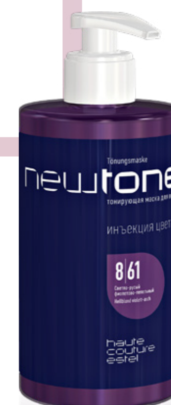
ТОНИРУЮЩАЯ МАСКА ДЛЯ ВОЛОС NEWTONE ESTEL HAUTE COUTURE 8|61 СВЕТЛО-РУСЫЙ ФИОЛЕТОВО-ПЕПЕЛЬНЫЙ 435 мл арт. NT8/61

Ультрамодный оттенок с изысканными переливами цвета. Холодный и искрящийся, он завораживает с первого взгляда.