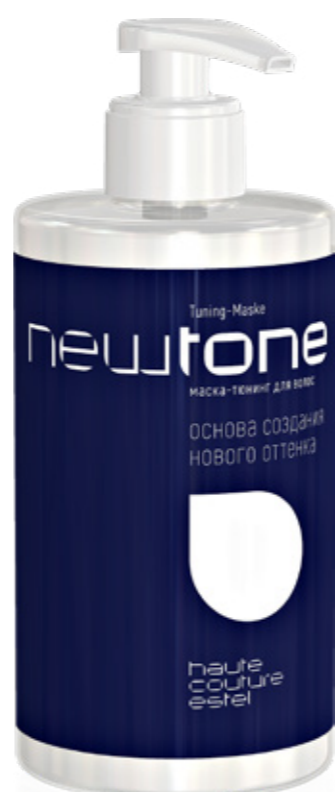
МАСКА-ТЮНИНГ ДЛЯ ВОЛОС NEWTONE ESTEL HAUTE COUTURE 0|00 НЕЙТРАЛЬНЫЙ 435 мл арт. NT0/00

Для обновления цвета и придания глубины оттенку.