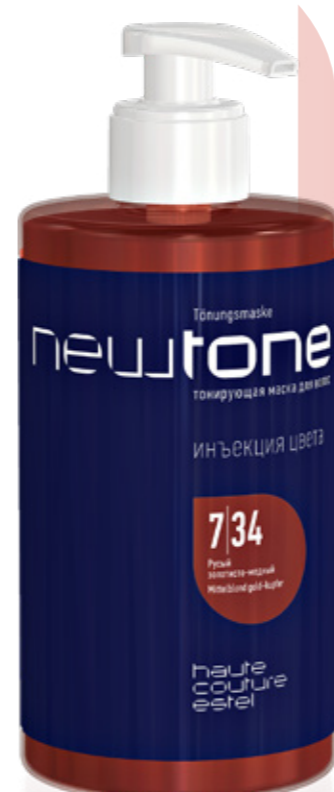
ТОНИРУЮЩАЯ МАСКА ДЛЯ ВОЛОС NEWTONE ESTEL HAUTE COUTURE 7|34 РУСЫЙ ЗОЛОТИСТО-МЕДНЫЙ 435 мл арт. NT7/34

Для получения более прозрачных оттенков смешивается с выбранным тоном. Используется как самостоятельное средство для придания волосам дополнительного сияния.