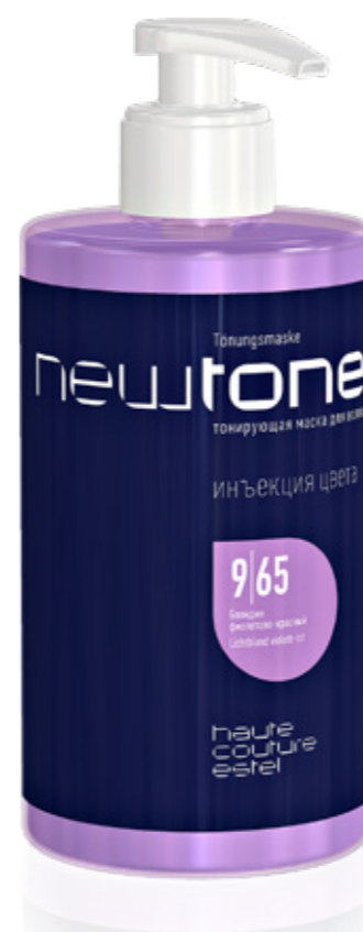
ТОНИРУЮЩАЯ МАСКА ДЛЯ ВОЛОС NEWTONE ESTEL HAUTE COUTURE 9|65 БЛОНДИН ФИОЛЕТОВО-КРАСНЫЙ 435 мл арт. NT9/65

Для поддержания оттенка и коррекции цветового нюанса.