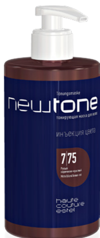
ТОНИРУЮЩАЯ МАСКА ДЛЯ ВОЛОС NEWTONE ESTEL HAUTE COUTURE 7|75 РУСЫЙ КОРИЧНЕВО-КРАСНЫЙ 435 мл арт. NT7/75

Для обновления цвета и восстановления яркости.