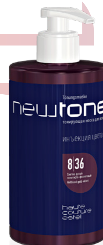
ТОНИРУЮЩАЯ МАСКА ДЛЯ ВОЛОС NEWTONE ESTEL HAUTE COUTURE 8|36 СВЕТЛО-РУСЫЙ ЗОЛОТИСТО-ФИОЛЕТОВЫЙ 435 мл арт. NT8/36

Мягкое поддержание золотисто-медных нюансов. Усиление тёплых оттенков.