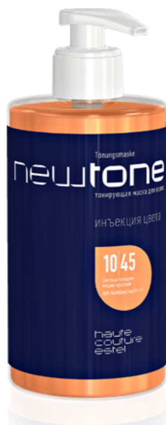
ТОНИРУЮЩАЯ МАСКА ДЛЯ ВОЛОС NEWTONE ESTEL HAUTE COUTURE 10|45 СВЕТЛЫЙ БЛОНДИН МЕДНО-КРАСНЫЙ 435 мл арт. NT10/45

Восхитительный венецианский блонд обретает новое звучание, преобразаясь в ультрамодный оттенок. Наполните волосы неземным медно-красным мерцанием, напоминающим отражение закатного солнца на глади воды.