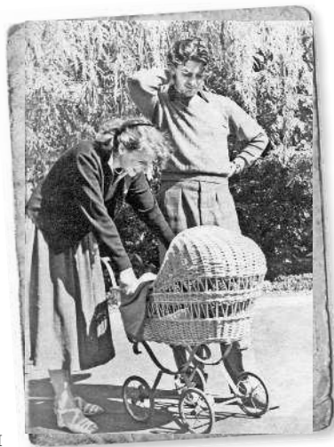
Та самая коляска

Наверное, это самая трогательная фотография моего детства, именно она во всех папиных мемуарах иллюстрирует появление долгожданного сына! Но есть один нюанс: на этой картинке я появился только как медийный персонаж! Непонятно? Приглядитесь внимательнее к коляске... Видите?.. Нет?.. А сейчас? Да! Правильно! Она пуста!!! Дело происходит на съемках. Моя будущая мама приехала проводить моего будущего папу, и там, в реквизите, нашлась очень красивая коляска. Родители просто сфотографировались на ее фоне! Ну а чего еще