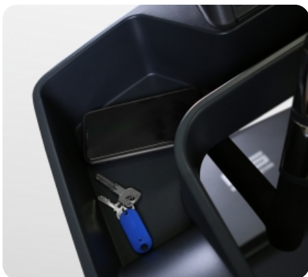
Специальное отделение для хранения личных вещей