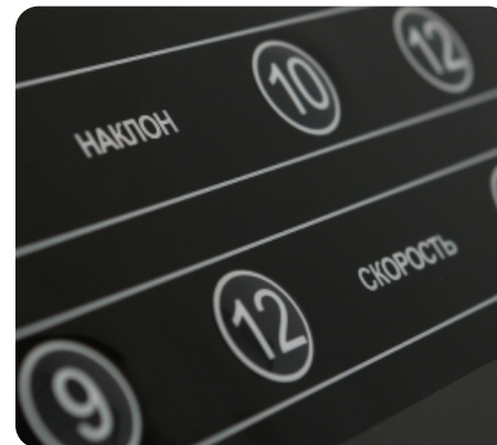
Русифицированные сенсорные кнопки управления