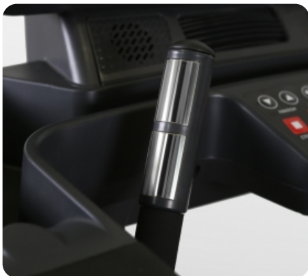
Сенсорные датчики пульса