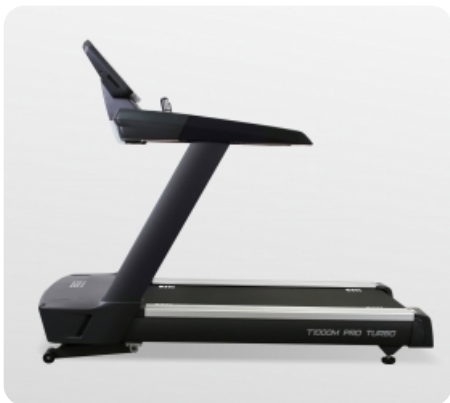
Высокопрочная рама из толстого профиля