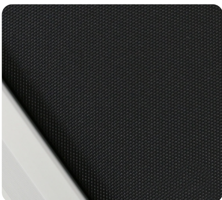
Профессиональное полотно толщиной 2.5 мм