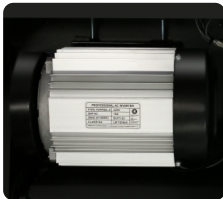
Двигатель мощностью 5 л.с.