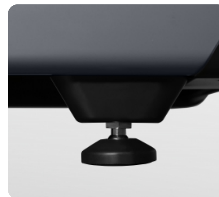
Компенсаторы неровностей пола