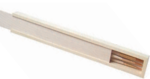
Деревянный пенал с искусственными кисточками.

Всегда стоит проверить, нет ли на кисти остатков краски. В этом случае следы краски останутся на салфетке.