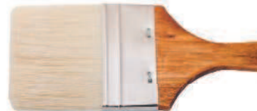
Флейц из свиной щетины.