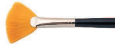
Веерная кисть из искусственного волоса.