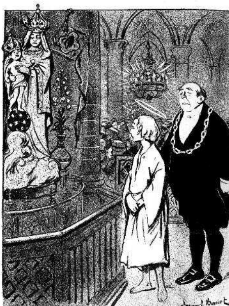
LE BIDEAU. — C'est la Sainte Vierge... JESUS. — Pauvre maman (Elle qui était si jolie !)

Даже в антиклерикальной карикатуре XIX–XX вв. фигура Христа могла использоваться и для атаки против христианства или религии в целом, и для того, чтобы показать, что конкретные Церкви давно о Христе позабыли. На одном из рисунков, вышедших в 1907 г. в пред рождественском номере французского сатирического журнала « Assiette au beurre », юный Иисус, стоя в церкви, обескураженно смотрит на разукрашенную статую Девы Марии и печально замечает: «Бедная мама, она ведь была такая красивая» (3). Это выпад против безвкусицы массового церковного искусства, благочестивого китча XIX в.: