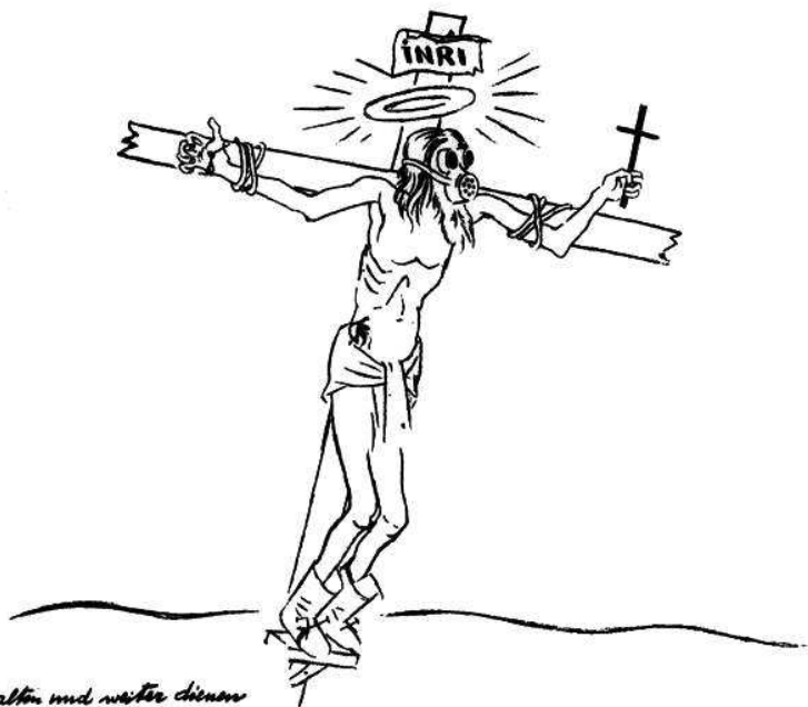
1. Георг Гросс. Распятие, 1927 г.

сумев доказать вины художника и его издателя, все же постановил конфисковать и уничтожить тираж рисунков. В январе 1933 г., незадолго до того, как Гитлер занял пост канцлера, художник, которого нацисты давно клеймили как большевика и врага отечества, был вынужден покинуть Германию.