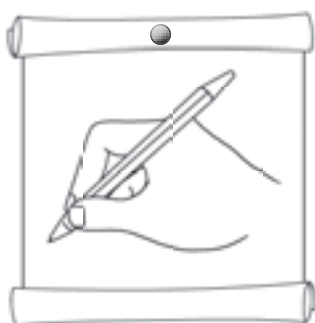
Так правильно держат ручку