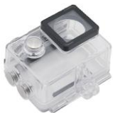
Водо- непроницаемый бокс