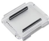
Крышка для бокса с прорезями