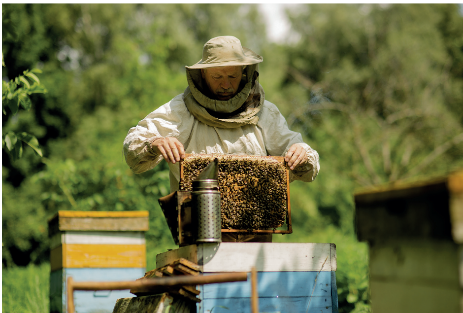
На пчальніку ў Лаўрышаве

Мастацтва суверэннай Беларусі = Искусство суверенной Беларуси = The Art of Sovereign Belarus : альбом / склад. К. В. Ізафатава [і інш.] ; пер. на англ. мову: Т. А. Асадчанка, А. Д. Стралкоўская. — Мінск : Беларуская Энцыклапедыя імя Петруся Броўкі, 2016.