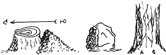
Ориентирование по предметам

у сосны) видна мокрая темная полоса, которая с северной стороны поднимается выше на 1–2 м. И вторичная кора у сосны, та, которая потрескалась, с севера также поднимается выше по стволу. В жаркую погоду у смолистых деревьев, таких, как ель и сосна, больше смолы выделяется с южной стороны. А у берез с южной стороны кора светлее и эластичней. Ветви у деревьев гуще растут с юга. Впрочем, часто случается, что ветви гуще расположены там, где больше свободного места. Опять же, сила ветра, особенно на побережьях, может заставить крону дерева тянуться в любую другую сторону.