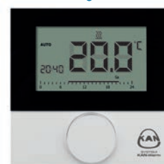
Термостат с ЖК-дисплеем Control отопление/охлаждение 230В/24В