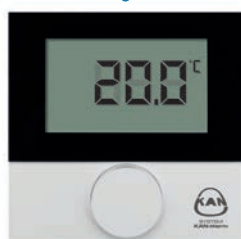
Термостат с ЖК-дисплеем Standard отопление 230В/24В