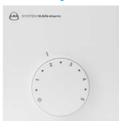
Аналоговый термостат отопление 230В/24В