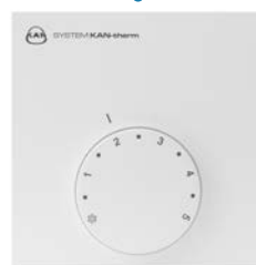
Аналоговый термостат отопление/охлаждение 230В/24В