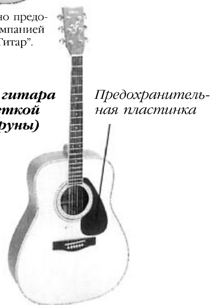
Акустическая гитара с круглой розеткой (стальные струны)