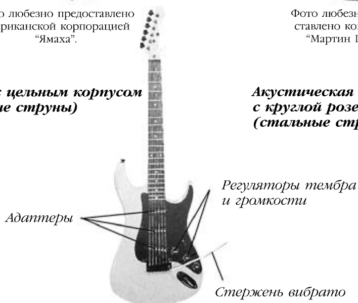
Гитара с цельным корпусом (стальные струны)