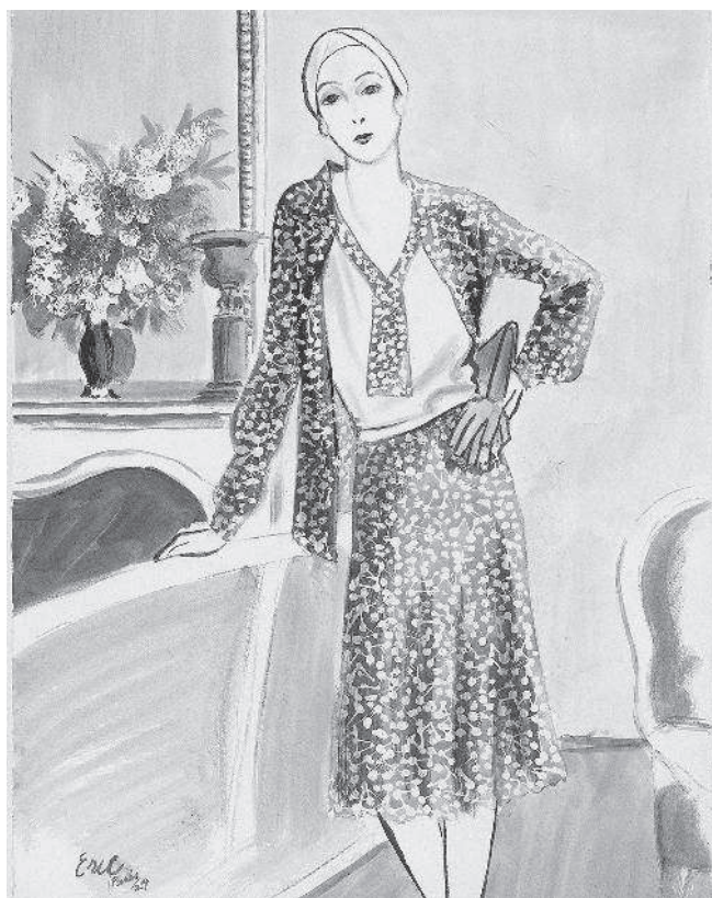
Стильный портрет работы Эрика.

Главная цель этой книги — помочь вам обрести свой собственный стиль, такой же уникальный и неповторимый, как и руки, которыми вы будете создавать свои рисунки. Хотя все упомянутые мной художники творили в единой эстетике, каждый из них шел своим собственным путем, поэтому возьмите понемногу от каждого — это поможет вам найти свое место в мире искусства изображения моды.