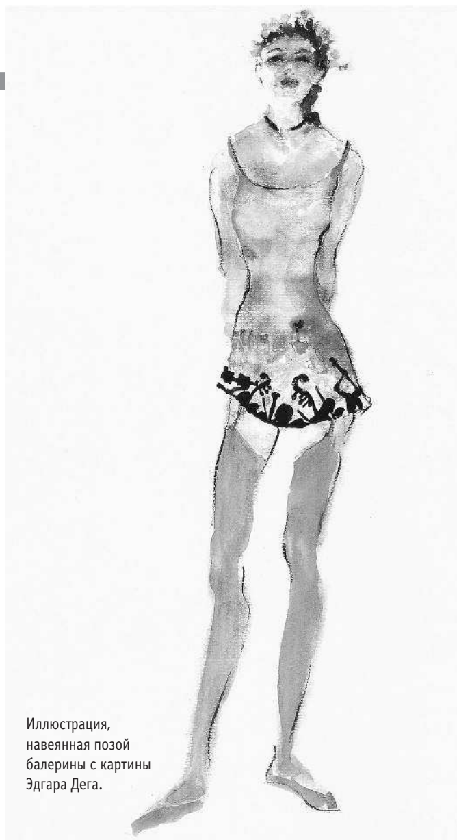
Иллюстрация, навеянная позой балерины с картины Эдгара Дега.

Рисунки Вивьен Вествуд, с ее великолепными силуэтами, историческими пометками и образцами тканей, отлично передают движение и страстность, которыми пронизан ее показ. Довольно трудно изобразить свободное движение в одежде в крупную клетку, но умение показать это так, чтобы рисунок передавал безумный шум и суету показа, присутствие множества известных персон и неповторимую индивидуальность моделей, дорогого стоит.