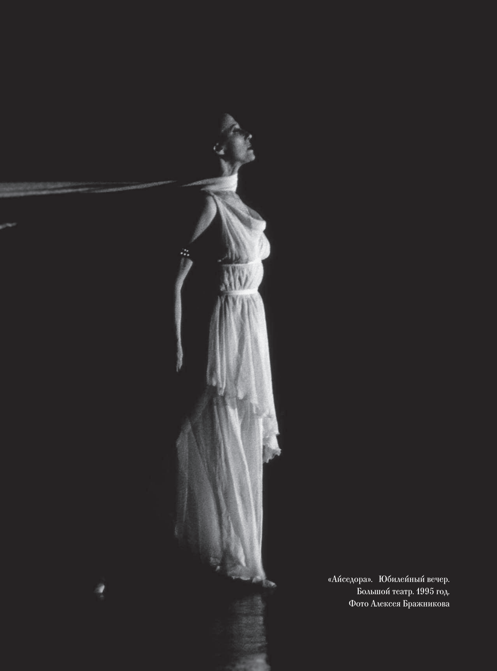
«Айседора». Юбилейный вечер. Большой театр. 1995 год.