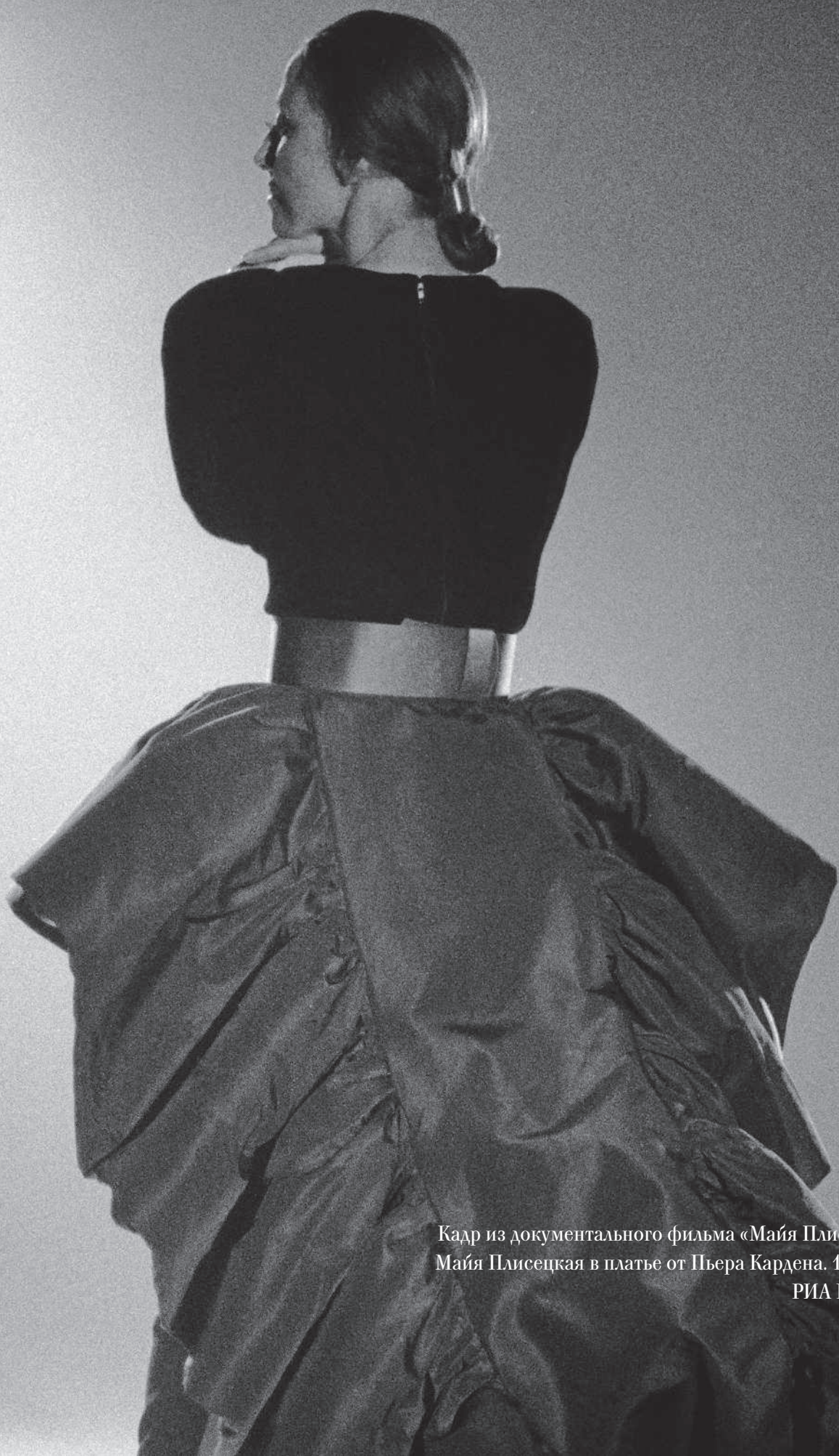
Кадр из документального фильма «Майя Плисецкая». Майя Плисецкая в платье от Пьера Кардена. 1987 год.