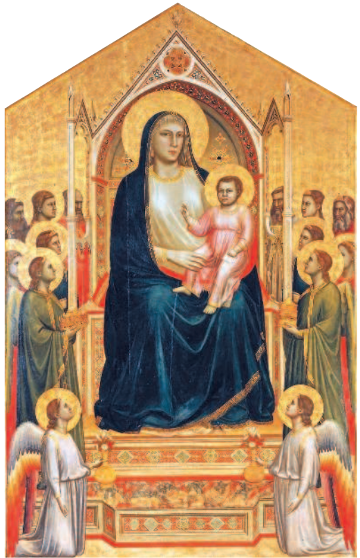
ДЖОТТО. Мадонна на троне. Ок. 1310. Галерея Уффици, Флоренция

Чимабуэ «Мадонна с младенцем» необыкновенно изысканна, необыкновенно изящна, хочется сказать, что Чимабуэ не только художник Средневековый, он художник готический, его Мадонна изумительно красива, декоративна. Долгие пальцы, длинные руки не держат младенца, а делают знак, что они его держат, лицо ее передает принятый в византийской живописи канон, вос-