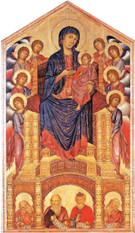
ЧИМБУЭ. Мадонна с младенцем. Конец XIII века. Галерея Уффици, Флоренция