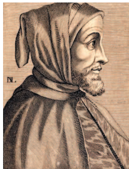
ЧИМАБУЭ — учитель Джотто ди Бондоне

Кисть Чимабуэ славилась одна, А ныне Джотто чествуют без лести, И живопись того затемнена.