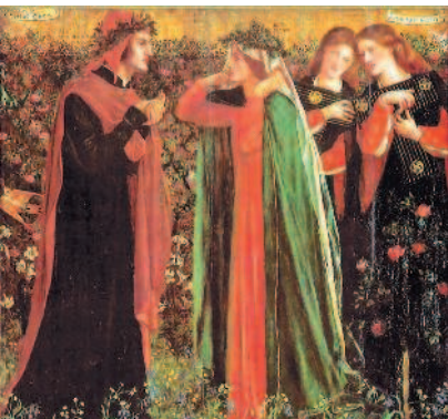
...А так видели его прерафаэлиты — рядом с возлюбленной Беатриче

А вот портретов Джотто не осталось — ему было не положено. В то время художники еще не писали автопортреты. Как выглядел Джотто — основоположник Возрождения, мы знаем из словесных описаний Бокаччо и Вазари. Они свидетельствуют, что он не был красив, но зато был весел и обаятелен в общении. Однако любой художник оставляет через творчество свой автопортрет — не в зеркале, но в образе. Крупное, плотное тело, полнощекое лицо, густые копны волос. Располагающие к себе герои Джотто, несомненно, — некая тень, некий фантом ясного, здорового духом, глубокого гения Джотто.