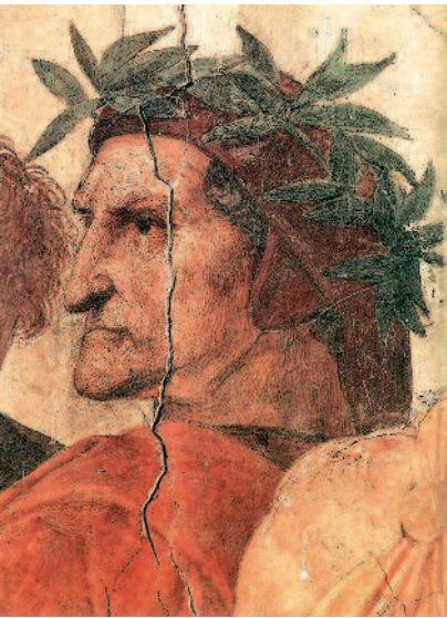
Так изобразил гениального поэта в своей фреске «Диспута» Рафаэль Санти...