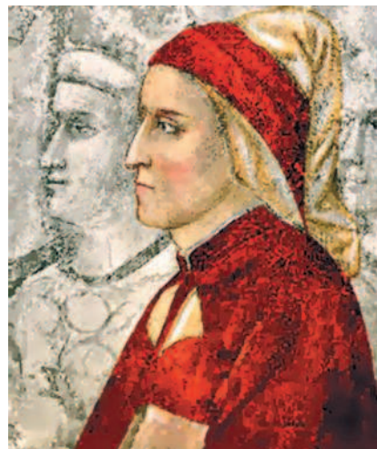
ДАНТЕ АЛИГЬЕРИ — последний поэт Средневековья и первый поэт Возрождения. Фреска работы Джотто ди Бондоне

И Данте и Джотто были флорентийцами. Они, правда, происходили из разных социальных слоев: Джотто, как сообщают источники, был то ли сыном крестьянина, то ли сыном кузнеца, а вот род Данте Алигьери был очень старинным и аристократическим, его предки строили Флоренцию. Но ведь гениальность не знает никаких социальных границ и градаций! Да, эти два человека прожили разную жизнь: Данте — полную политических страстей и изгнаний, а Джотто,