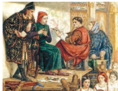
ДАНТЕ ГАБРИЭЛЬ РОССЕТТИ изобразил сцену создания знаменитой фрески Джотто