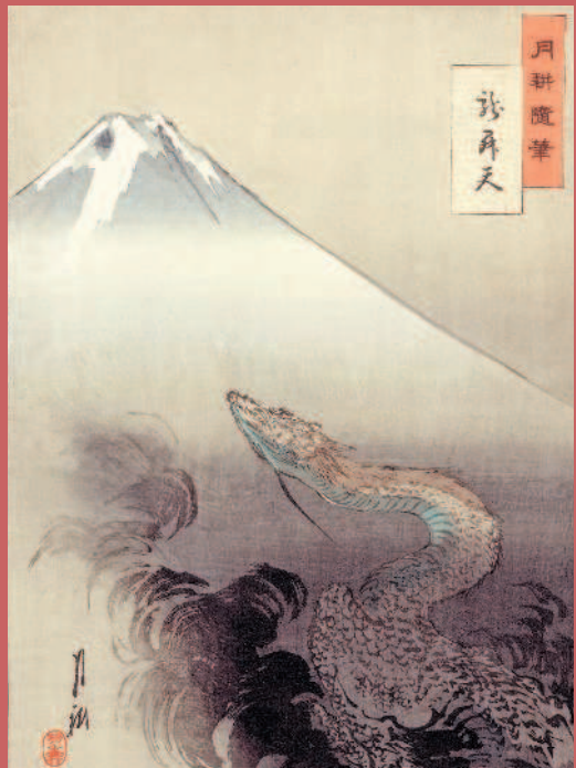
ГЭККО. Дракон, поднимающийся к небу. Набросок. 1897.