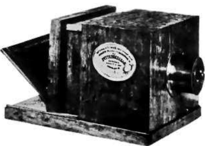
Оригинальная камера Дагера, сделанная Альфонсом Жиру

света и тени, градации цветов, цветовых и световых контрастов. Большое влияние на формирование «нового взгляда» в живописи оказали выставки японских гравюр на дереве, которые прошли в Париже в 1850–1860-х годах. Использование японскими мастерами ярких, чистых цветов, схематическая передача формы, свободное отношение к законам перспективы позволили художникам увидеть новые возможности в живописи и пересмотреть свой подход к изображению предметов.