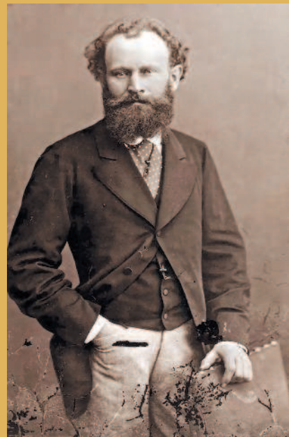
НАДАР. Портрет Эдуарда Мане. Ок. 1870

ЭДУАРД МАНЕ (1832–1883) — французский художник и гравер, считается одним из основоположников импрессионизма в живописи. Многие его картины стали украшением самых прославленных музеев мира. Эдуард появился на свет 23 января 1832 года в квартале Парижа Сен-Жермен-де-Пре на улице Малых Августинцев. Родителям Мане очень хотелось, чтобы Эдуард продолжил отцовское дело и построил блестящую карьеру на государственной службе. В семилетнем возрасте они отдали мальчика учиться в пансион аббата Пуалу. К учебе Эдуард оказался абсолютно равнодушным. Единственное, что привлекало юного Мане, — это живопись. В этом увлечении ему способствовал дядюшка Фурнье. Бывая часто в доме сестры, он дружил с ее детьми, по воскресеньям водил их в Лувр. Мужчина сразу обратил внимание на старшего племянника, Эдуарда, который не просто рассматривал картины в музее, а с альбомом и карандашом в руках делал какие-то наброски.