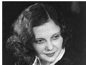
Моя мама еще до знакомства с моим папой. Париж