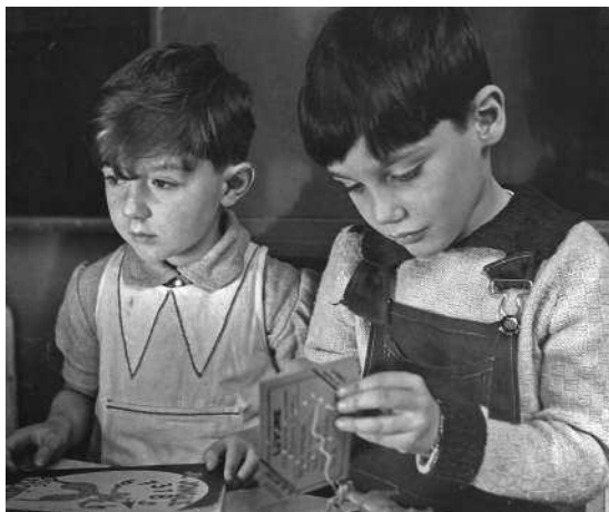
Мне 5 лет. Детский сад в Париже

— Что ж, попробую, — взял кораблик и стал возиться с веревкой. Я наблюдал за ним крайне внимательно, и почему-то сильное впечатление произвело на меня небольшое вздутие, которое я заметил на безымянном пальце его левой руки. Он легко справился с узлом, отчего я почувствовал себя неумехой, и отдал мне кораблик. Я поблагодарил его. А мама сказала: