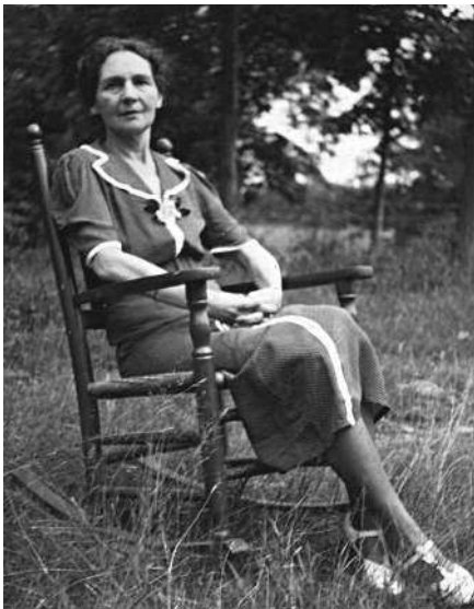
Бабушка незадолго до смерти

Дети, перебираясь из страны в страну, получали лишь поверхностное образование и в конце концов были размещены матерью в школы-интернаты. Моя мама попала в школу при католическом женском монастыре в городе Дамфризе в Шотландии. Завершив там учебу, она вернулась в Париж, где устроилась работать монтажером во французском филиале американской кинокомпании Paramount. Вскоре она встретила моего отца.