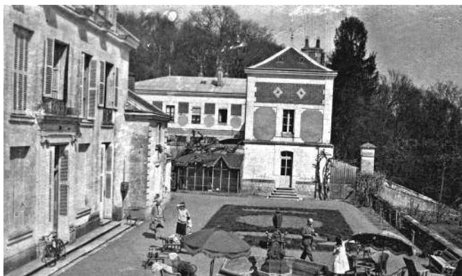
Шато, которое снимала моя бабушка, чтобы сдавать его богатым гостям