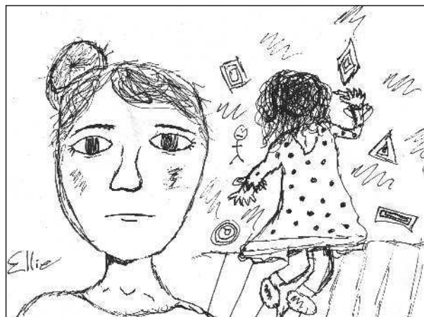
«Вот кого я называю монстром!» рисунок Е. А. О'Нилл, 10 лет, 2017.

того момента, пока старший сын не решил надеть тарелку с едой на голову младшего брата, который, вопреки всем попыткам приучить его к горшку, почему-то продолжает считать прицельное мочеиспускание наиболее эффективным методом обороны.