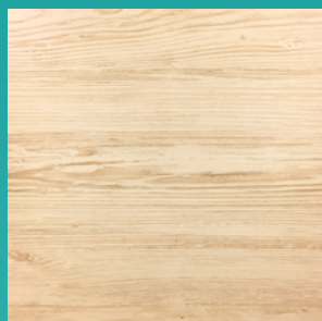
ДСП и ДВП