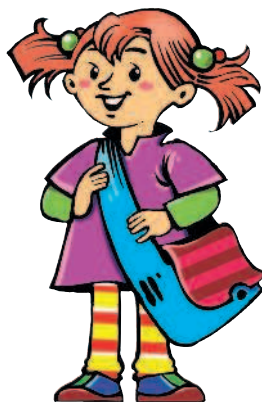
die Tochter [тохтэр] дочь