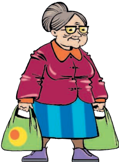
die Oma [ома] бабушка