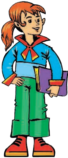
die Schwester [швэстэр] сестра