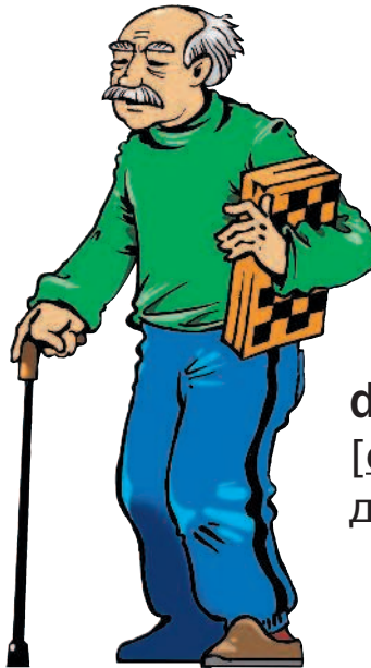
der Opa [опа] дедушка