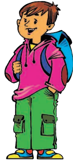
der Bruder [брудэр] брат