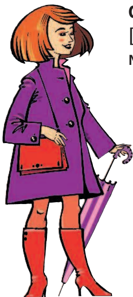
die Mutter [мүтэр] мать