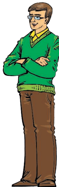
der Vater [фатэр] отец