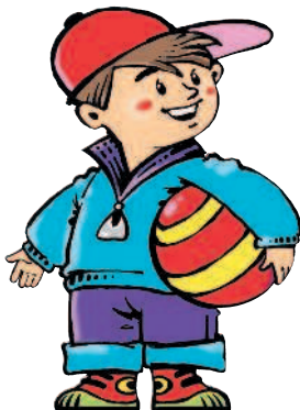
der Sohn [зон] сын