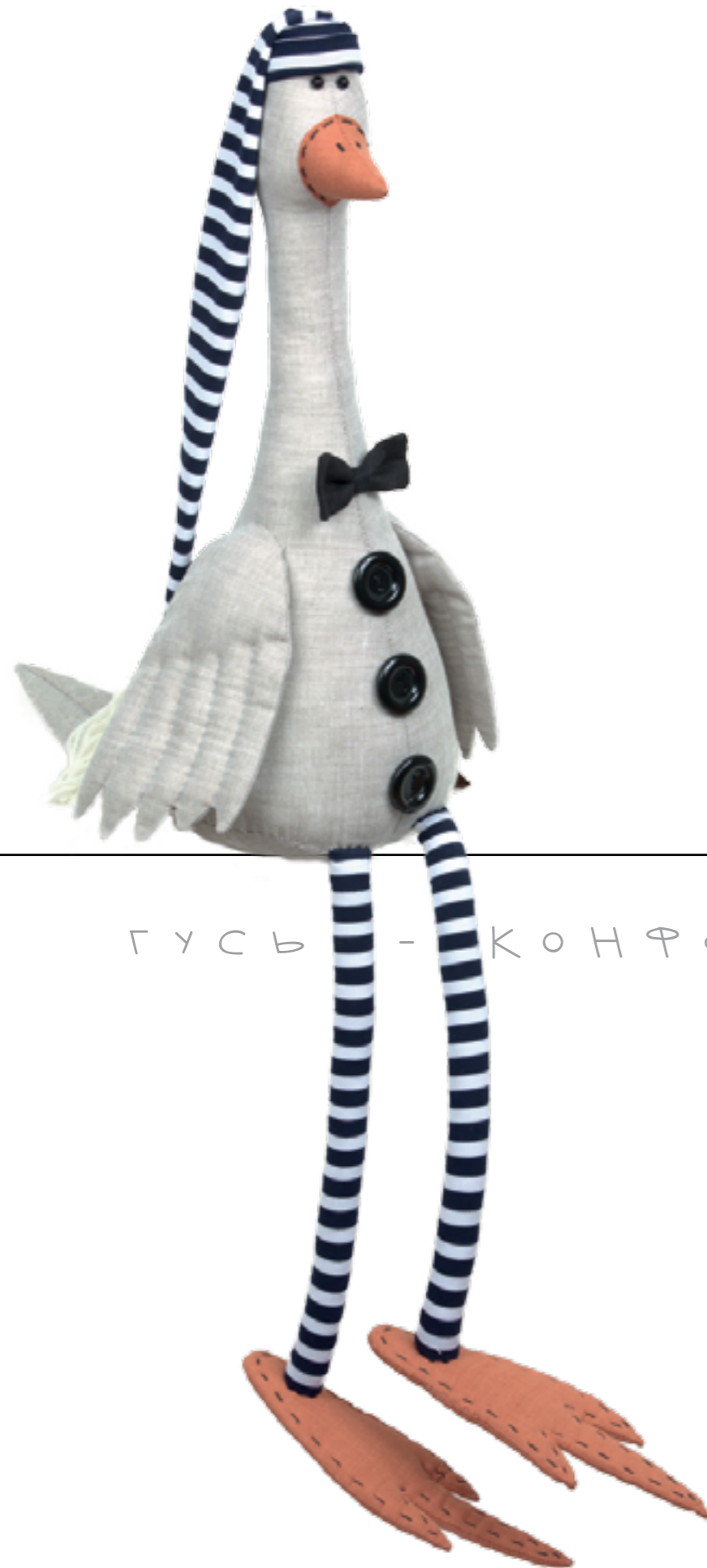
ГУСЬ - КОНФЕРАНСЬЕ

ЭТОТ ПЕТУХ ПОХОЖ НА ПЕРСОНАЖА МОРГУНОВА ИЗ ФИЛЬМА "ОПЕРАЦИЯ "Ы".