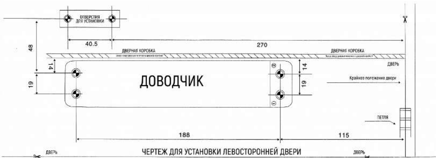
ЧЕРТЕЖ ДЛЯ УСТАНОВКИ ЛЕВОСТОРОННЕЙ ДВЕРИ

Ширина дверного полотна: 900-1200 мм Вес дверного полотна: 45-75 кг Регулируемая секция скорости закрытия: 180-20 Регулируемая секция скорости фиксации: 20-0