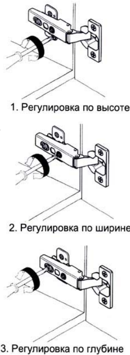
Схема регулировки петли