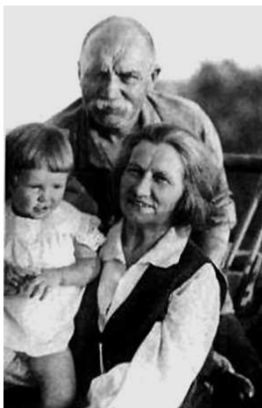
С мамой и папой