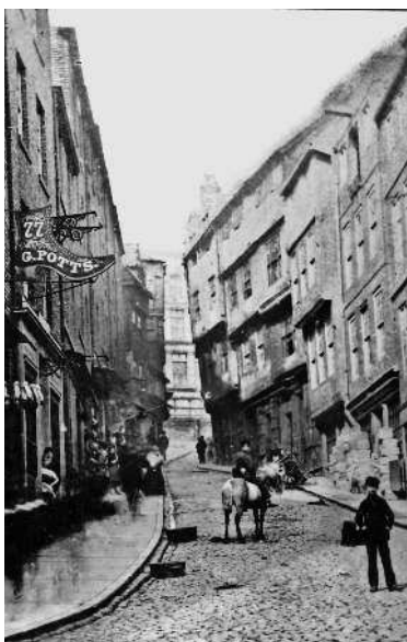
Рабочие окраины Ньюкасла-на-Тайне

его опыт нахождения в подполье наделил его в полной мере качествами, необходимыми для разведчика. Он умел незаметно передавать соратнику секретные материалы, уверенно выявлять наружное наблюдение, уходить от слежки, устраивать надежные тайники, быстро разоблачать провокаторов. Очевидно именно эти качества, унаследованные от опытного конспиратора, каковым был отец, позволили впоследствии Вильяму Генриховичу стать одним из величайших разведчиков в истории.