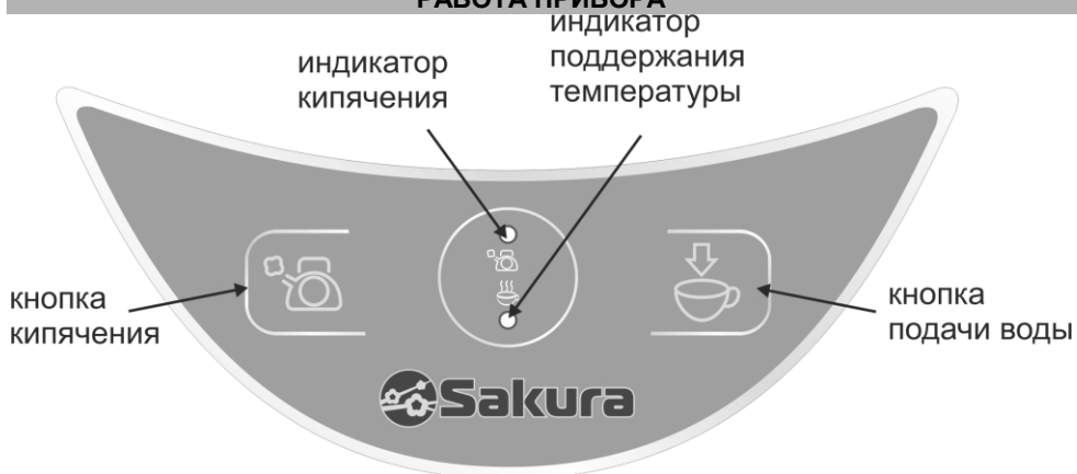
Рис.2. Панель управления