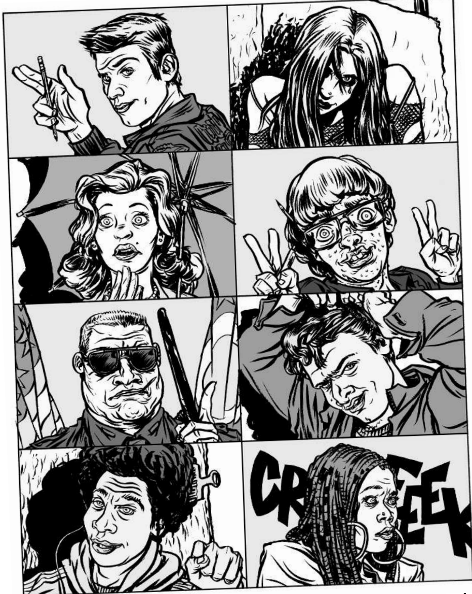
8 наиболее распространенных типажей в фильмах ужасов

то это актеры из «Тайн Смолвиля» или «Девочек Гилмор»? (Если это правда, то шанс встретить преждевременную кончину возрастает на 10 пунктов.)