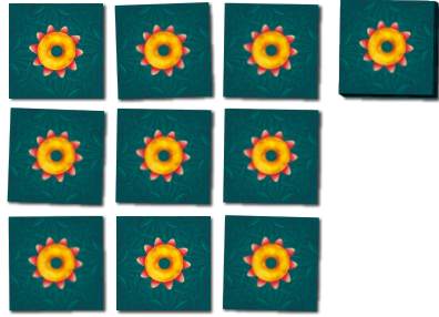
Пример подготовки к игре