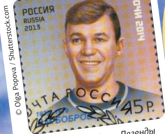
Россия, марка 2013 г., «Легенды спорта». На марке изображен Всеволод Бобров (1922—1979). XXII зимние Олимпийские игры и XI Паралимпийские игры 2014 г. в Сочи.

Первые матчи официального чемпионата СССР по хоккею с шайбой прошли в 1946 г. В 1952 г. Федерация хоккея СССР была принята в Международную федерацию хоккея. А спустя два года сборная СССР впервые участвовала в чемпионате мира, причем одержала на нем победу. Лучшим игроком отечественной сборной был признан Всеволод Бобров, лучшим бомбардиром в истории чемпионатов мира — нападающий Борис Михайлов. Анатолий Фирсов (нападающий сборной) — единственный хоккеист, который возглавлял список лучших игроков по системе «гол + пас» на четырех чемпионатах. Выдающийся вратарь Владислав Третьяк играл в 13 чемпионатах мира и на четырех из них удостоился звания «Лучший вратарь».