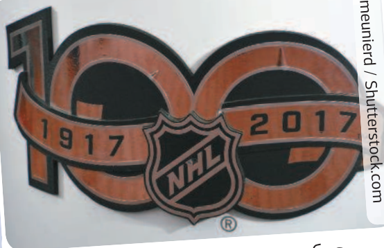
Монреаль, Канада, 17—19 ноября 2007 г. Логотип к 100-летию Национальной хоккейной лиги (НХЛ) на соревнованиях «Монреаль Канадиенс». НХЛ была основана в отеле «Виндзор» в 1917 г.