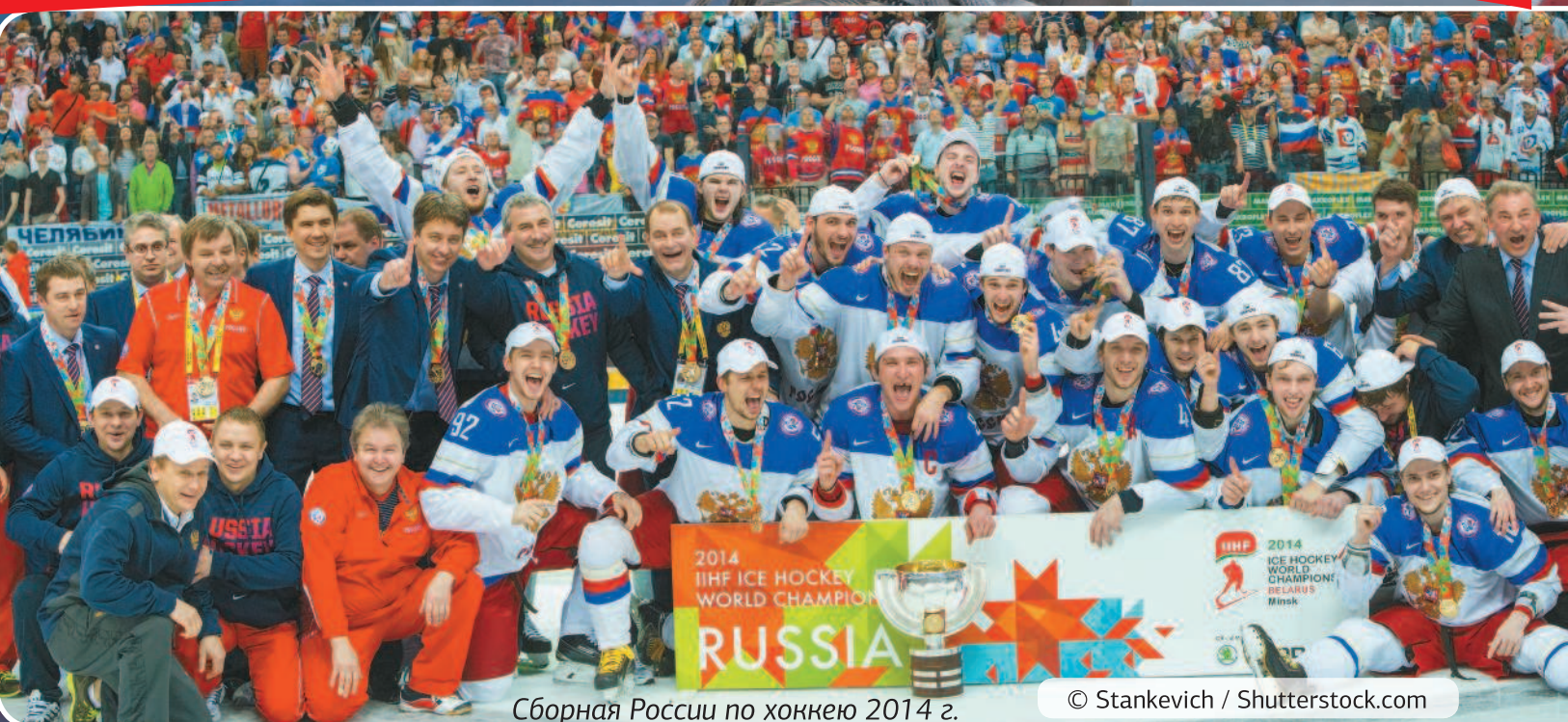
Сборная России по хоккею 2014 г.

В ИИХФ интересы российского хоккея представляет Федерация хоккея России, учрежденная в 1991 г. Эта организация занимается проведением на территории Российской Федерации официальных спортивных соревнований по хоккею. Кроме того, ФХР развивает и популяризирует профессиональный, любительский и детско-юношеский хоккей. С 2006 г. по настоящее время пост президента занимает Владислав Третьяк.