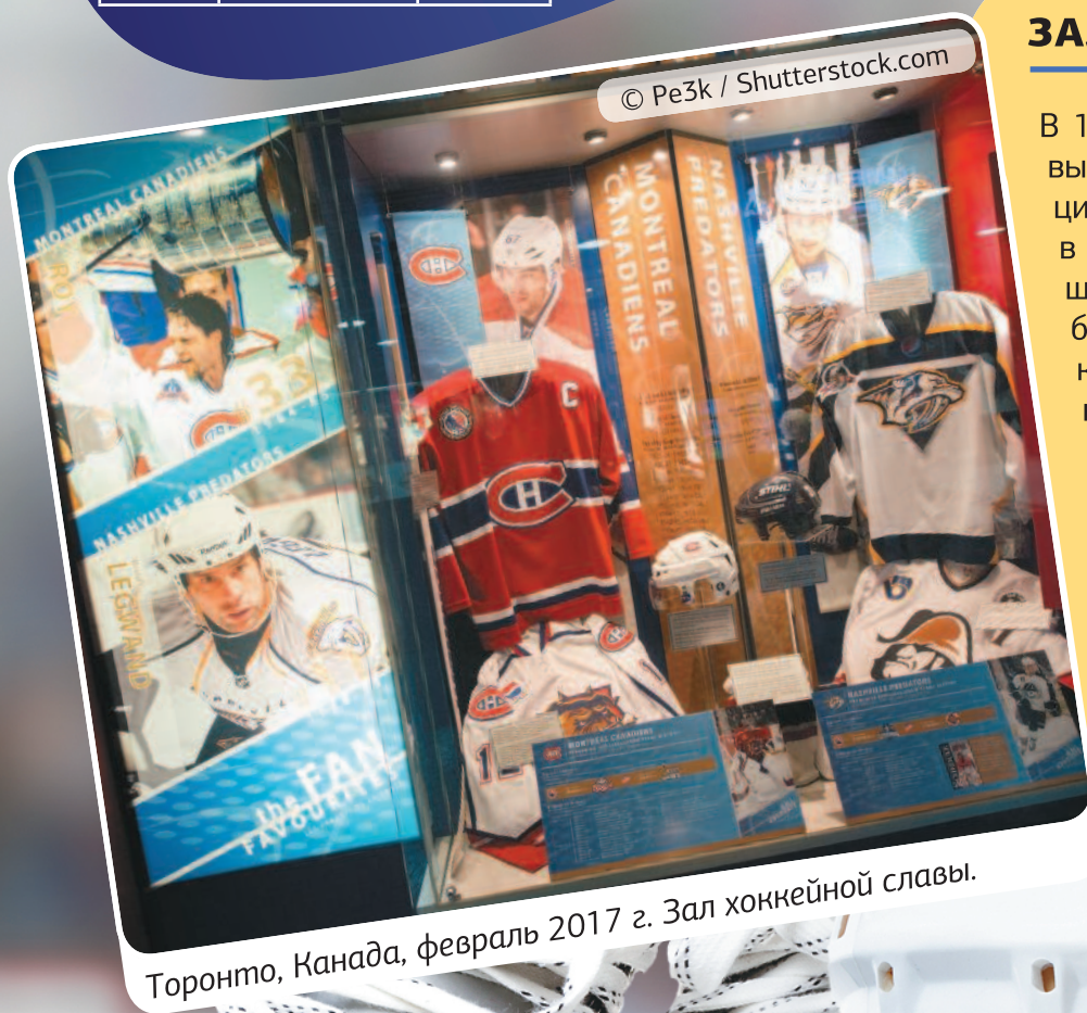
Торонто, Канада, февраль 2017 г. Зал хоккейной славы.

Мировой рейтинг ИИХФ представляет собой рейтинг национальных хоккейных сборных стран — членов Международной федерации хоккея на льду (ИИХФ). Он основывается на результатах выступлений на прошедших Олимпийских играх и на последних четырех чемпионатах мира, за которые присуждаются очки.