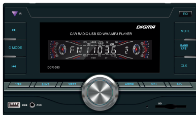
Автомобильный ресивер DCR-550