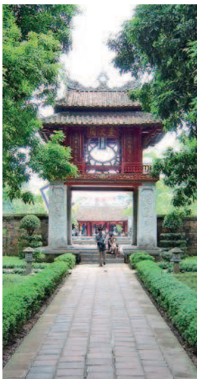
Ханой: храм Литературы

7–8-й день. После ночного переезда вас встречает величественный Хюэ. Один из дней в Хюэ целесообразно посвятить знакомству с достопримечательностями в центре города (в первую очередь стоит увидеть Императорскую цитадель), а на следующий день можно отправиться на осмотр гробниц императоров.