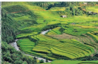
Рисовые террасы Сапы