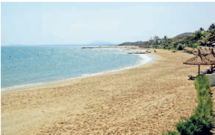
Пляжная полоса Муйне

10-й день. Если время до выезда в аэропорт и знакомство с далатским вином, произошедшее накануне, позволяют, возьмите экскурсию к экзотическим островам в окрестностях Нячанга. Если времени мало, то проведите день на городском пляже. В этот день нужно хорошенько накупаться-назагораться, а особо забывчивым – и пробежаться по сувенирным магазинчикам перед посадкой на самолет.