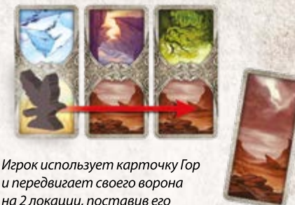
Игрок использует карточку Гор и передвигает своего ворона на 2 локации, поставив его на вторую карточку Гор.

перелет через три, а то и больше, локаций с одинаковым ландшафтом.