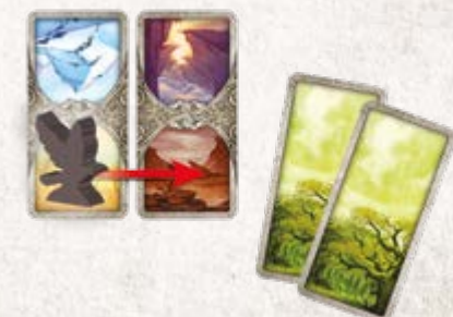
Игрок использует 2 карточки Леса, чтобы переместить своего ворона на одну локацию Гор.

Если у игрока нет карточек полета, которые совпадают с ландшафтом в локациях перед его вороном, он может использовать две любые одинаковые карточки полета так, как будто это нужная ему для перемещения карточка. Игроки складывают свои сыгранные карточки полета на столе лицом вверх в стопку сброса. Если стопка карточек полета закончится, игрок перетасовывает свою стопку сброса и формирует из нее новую стопку карточек полета.