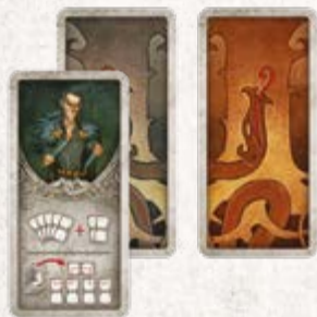
16 карточек Локи (по 8 для каждого игрока)