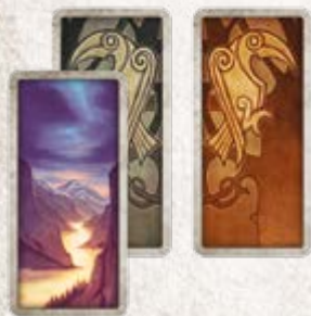
50 карточек полета (по 25 для каждого игрока)