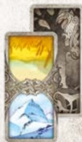
40 карточек земель