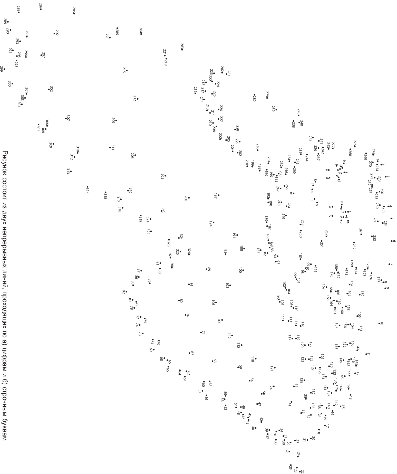
Рисунок состоит из двух непрерывных линий, проходящих по а) цифрам и б) строчным буквам