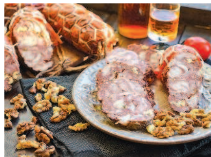
Мраморный мясной орех, с. 108