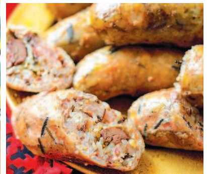
Рисовые колбаски с печенкой, с. 72