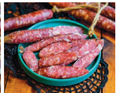
Кнуты к пиву, с. 83