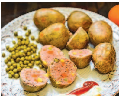
«Яйца дракона», с. 92