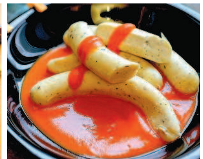
Диетические сосиски из индейки на пару, с. 89