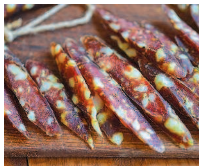
Сыровяленые колбаски с кунжутом, с. 80