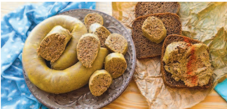
Колбасный печеночный паштет, с. 98