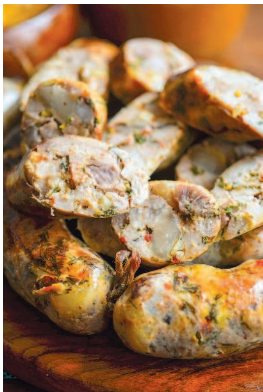
Венгерская пряная колбаса, с. 22