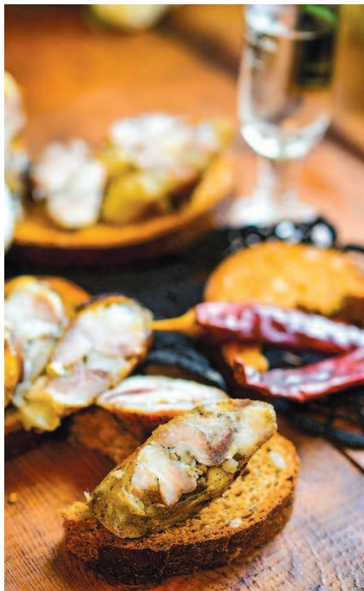
Закусочная колбаса из сала с чесноком, с. 52