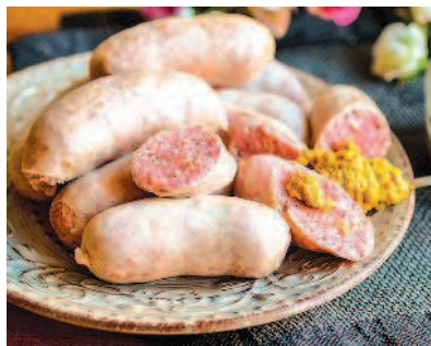
Сливочные сардельки, с. 95