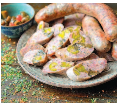
Праздничная колбаса, с. 45