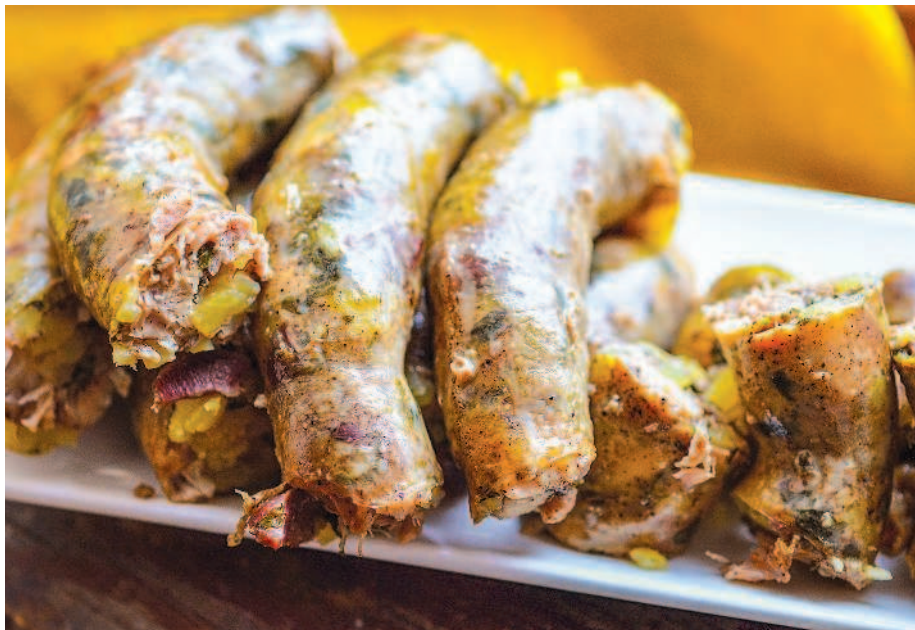
Куриная колбаса с картофелем, с. 16