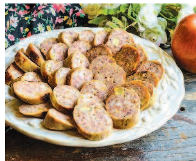
Мраморная колбаса с яблоками, с. 36