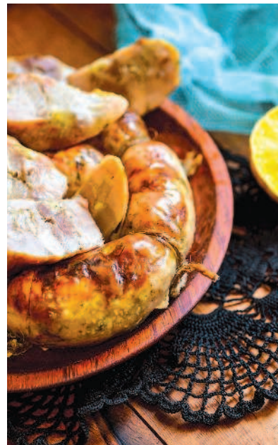
Украинская домашняя колбаса с чесноком, с. 19