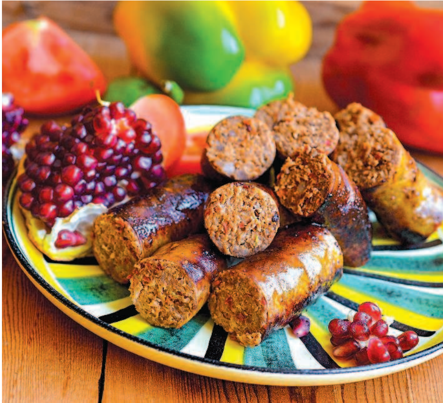
Чоризо по-мексикански, с. 66