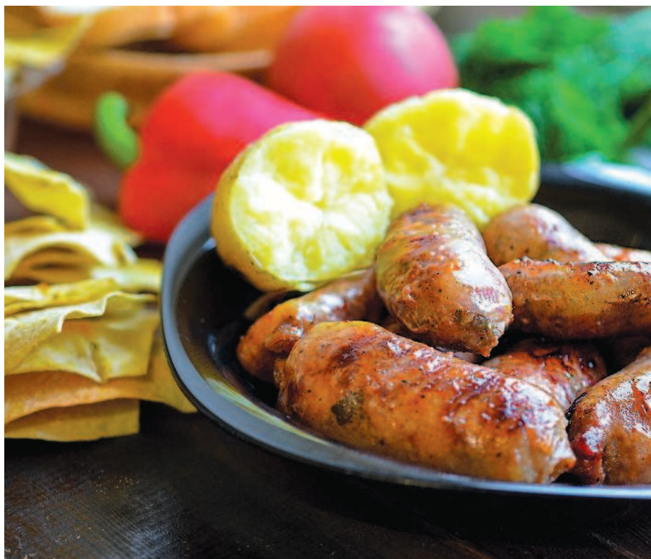
Колбаски из баранины с картофелем по-африкански, с. 63