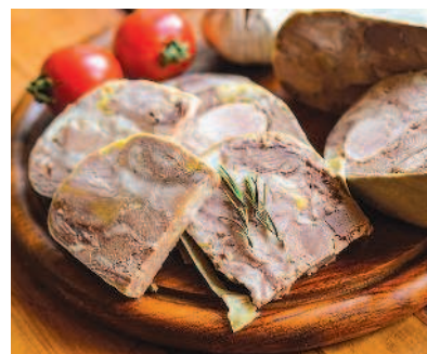
Сальтисон, с. 30