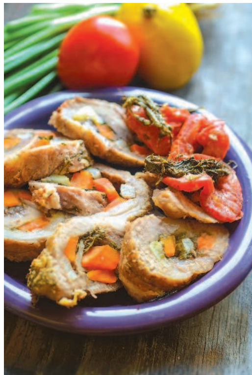
Рулеты из свинины, с. 101