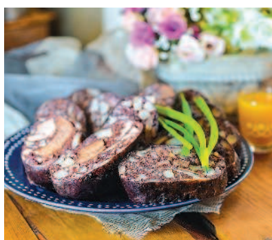
Кровяная колбаса с языком, с. 48