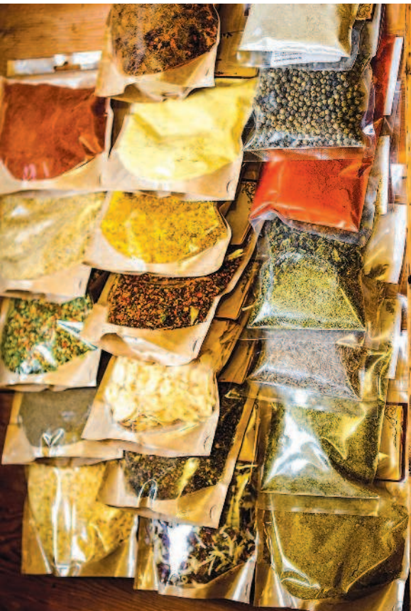
фото 3. Пряности

Люди используют пряности веками, и практически все они выступают неким лекарством, делая нашу жизнь длиннее и лучше. Я не буду описывать полезные свойства каждой из пряностей. Книга не об этом, к тому же такую информацию легко найти в свободном доступе. Я лишь упомяну, что самая важная роль пряностей – делать пищу вкуснее и красивее. Посудите сами, какой цыпленок табака – без чеснока, глинтвейн – без корицы, плов – без кумина или соленья – без укропа? Пряности придают еде нужную вкусовую нотку и аромат. Об этом все знают, и все этим пользуются. Колбасы тоже любят пряности. И, наверное, любят их особой любовью. Посмотрите, сколько сортов колбас на прилавках. А по сути – это все разные виды мяса в различном соотношении плюс свой набор пряностей (см. фото 3).