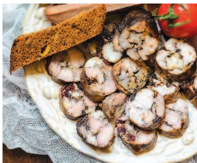
Колбаса с черносливом, с. 33