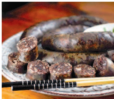
Сундэ, с. 42