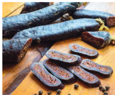
Суджук, с. 86