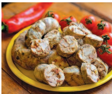
Колбаса из свинины и печенки с томатами, с. 26