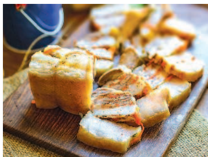
Слоеное закусочное сало, с. 106