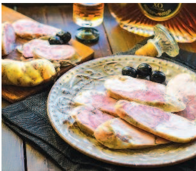
Пикантная ветчина, с. 40