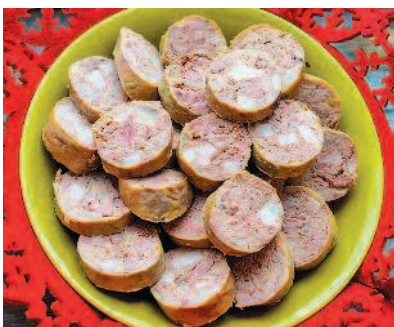
Печеночная колбаса, с. 55