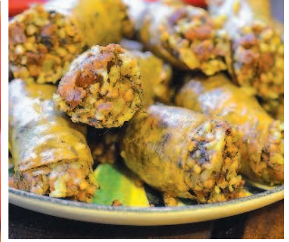
Колбаски с гречкой и травами, с. 69