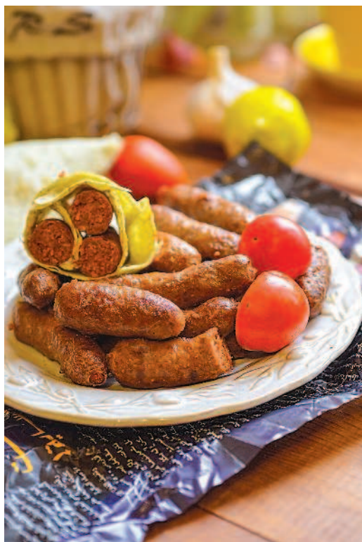
Острые колбаски мергез, с. 76