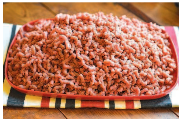
фото 2. Мясной фарш