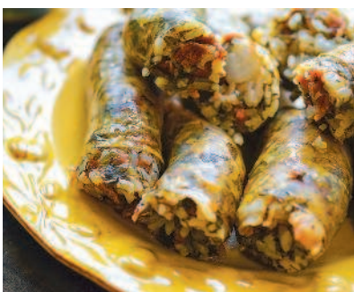
Осбан, с. 58