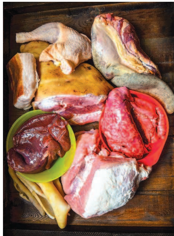
фото 1. Виды мяса для изготовления колбасных изделий

Совершенно не важно, как вы будете измельчать мясо – с помощью блендера, мясорубки, куттера или нарезать вручную обычным ножом. Главное, чтобы мясо было не перетерто, а именно порублено или нарезано.