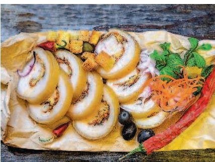
Руллет из сала с чесноком, с. 104