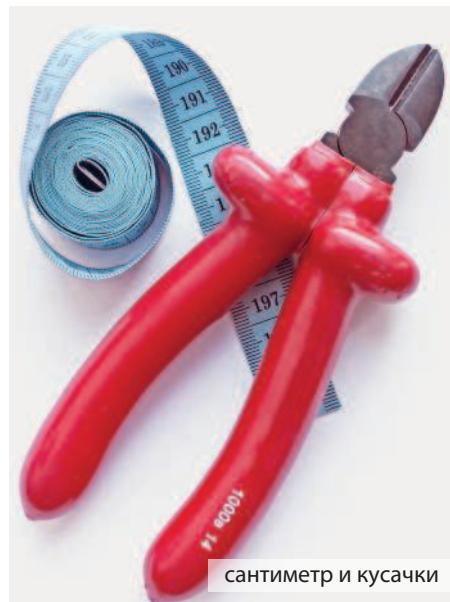
сантиметр и кусачки

Расскажу о том, как набирать бисер на проволоку с помощью спиннера. Высыпьте бисерины в чашу, заполнив ее примерно наполовину. Возьмите отрезок проволоки и сделайте маленькую петельку на одном