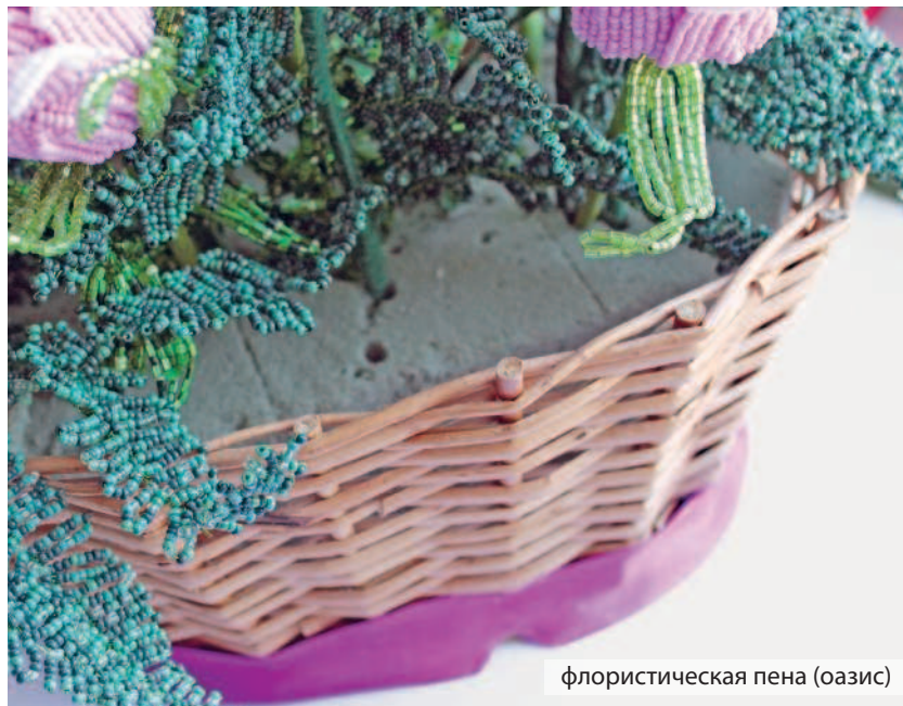
флористическая пена (оазис)

Используется для фиксации композиций и деревьев. Лучше выбирать оазис для искусственных цветов.