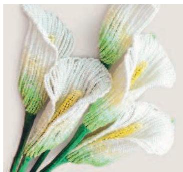
КАЛЛА СОЗДАНИЕ ЕСТЕСТВЕННОГО ГРАДИЕНТА ..... 137