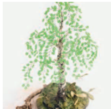
БЕРЕЗА в технике петельного плетения.....51