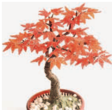
ОСЕННИЙ КЛЕН в технике параллельного плетения ..... 35