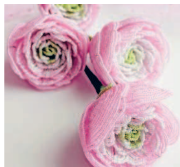
РАНУНКУЛЮС в технике французского плетения.....87