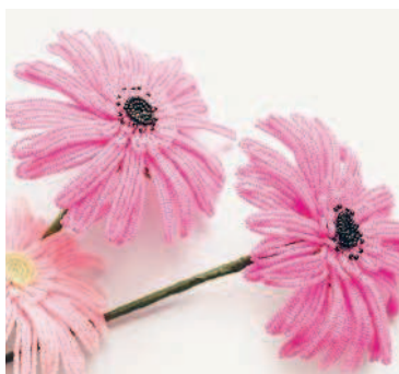
ГЕРБЕРА в технике петельного плетения (перекрестные петли) ... 69