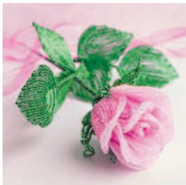
БОКАЛОВИДНАЯ РОЗА ЭФФЕКТ ЗАТЕМНЕНИЯ ..... 113