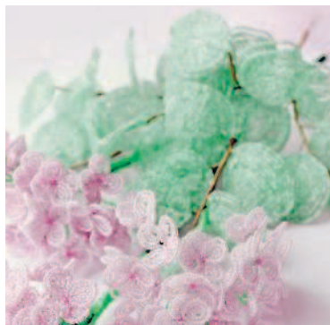
ВЕТОЧКИ ЗЕЛЕНИ ИСПОЛЬЗОВАНИЕ ЗАМЕСА ..... 107