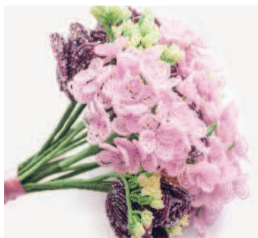
ГОРТЕНЗИЯ в технике петельного плетения (оплетенные петли) ..... 59