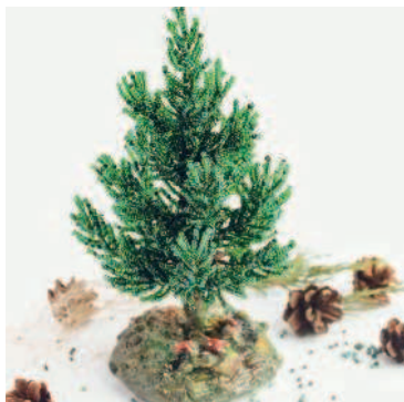
ЕЛЬ в технике игольчатого плетения..... 43