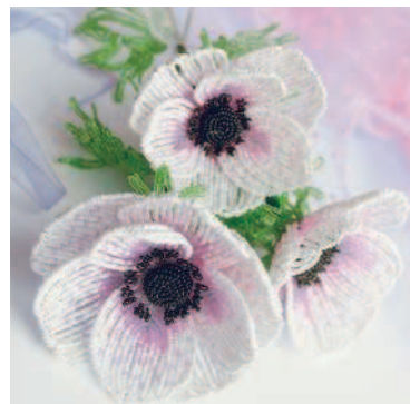
АНЕМОНА РАССТАНОВКА АКЦЕНТОВ ..... 123