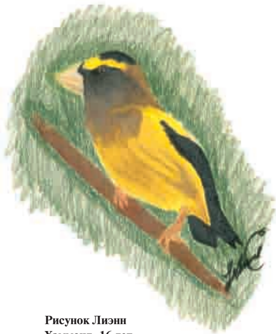
Рисунок Лиэнн Хэммонд, 16 лет

Мораль этой истории проста: вы тоже можете это сделать! Все, что вам требуется, это избавиться от старых воспоминаний о рисовании мелками, следовать моим указаниям и накапливать необходимый опыт. После того как вы прочувствуете особенности цветных карандашей, они перестанут вызывать у вас страх. Мои собственные первые результаты работы с цветными карандашами были плачевными, но теперь они стали одним из моих любимых художественных средств. Этот процесс требует много времени, настойчивости и практики. Многие ваши работы будут далекими от совершенства и недостойными, чтобы повесить их на стену. Но не судите себя слишком строго. Это неизбежная часть процесса обучения. (У меня в студии много корзин для мусора, и я не стесняюсь их использовать.) Со временем вы добьетесь результатов, которые вас приятно удивят!