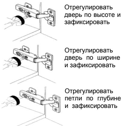
Рис. 6 (Регулировка дверок)

Мебель должна храниться и эксплуатироваться в сухих и теплых помещениях с температурой воздуха не ниже +5 гр С с относительной влажностью 40-70 %. Мебель рекомендуется устанавливать на расстоянии не менее 50 см от нагревательных приборов. Изготовитель гарантирует соответствие мебели требованиям ГОСТ 16371-93 «Мебель. Общие технические условия» при соблюдении условий транспортирования, хранения, сборки и эксплуатации.