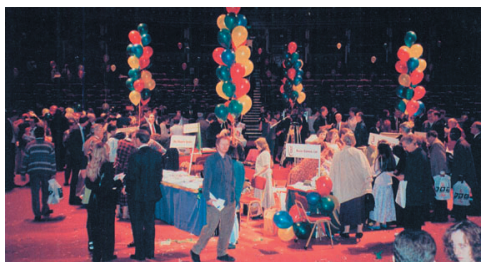
Рисунок 1. Фестиваль мышления в королевском Альберт-холле в Лондоне (1995) в честь совершеннолетия книги «Научите себя думать»