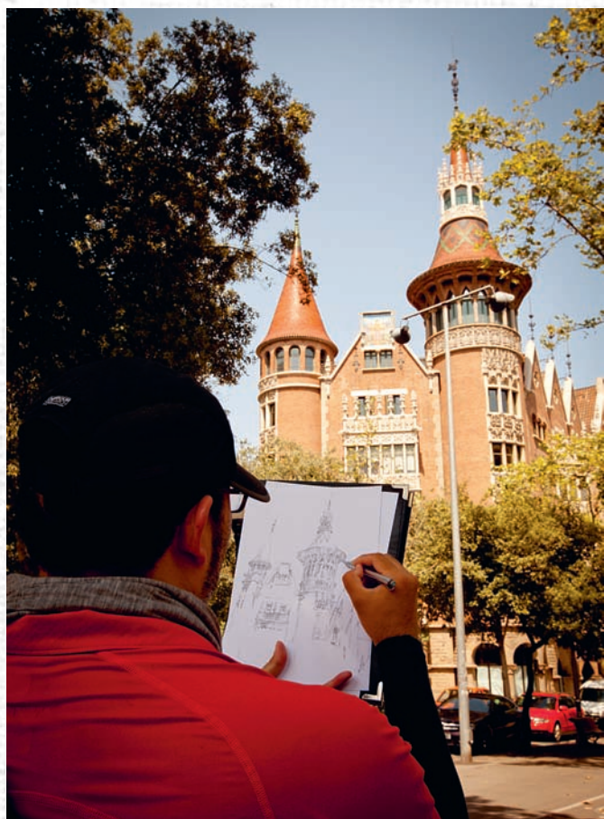
Дом с шипами, Барселона

А ядром этого удивительного художественного почину, распространяющегося через интернет, является сайт UrbanSketchers.org . Это онлайн-журнал, созданный группой художников и ориентированный на постоянное привлечение все новых и новых членов. В настоящее время в нем принимает участие ровно сто художников, отличающихся особой страстью к рисованию, желанием щедро делиться плодами своих трудов и помогать другим получать представление о разных городах мира. Тем, кто хочет учиться, лучшей стартовой площадки не найти. В нашем архиве хранятся тысячи зарисовок, которые вы можете посмотреть.