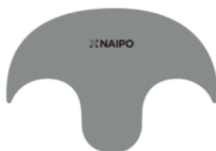
1 x паровая крышка