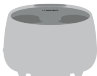
1 x массажер