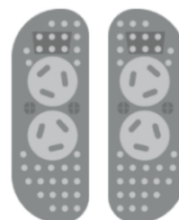
2 x массажные ролики