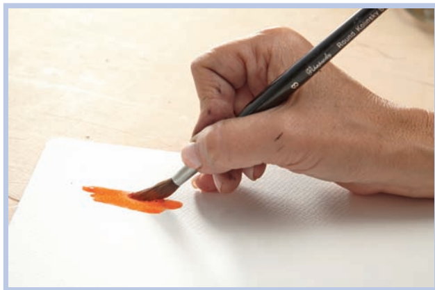
Неправильно: держать кисточку вертикально, как карандаш.

верхности бумаги так, чтобы волоски находились почти в горизонтальном положении. Ни в коем случае не делайте мазки вверх и вниз, как в случае, когда красите оконную раму или забор. Имейте в виду, что иногда нужно делать мазки особого рода — и тогда потребуется особое положение руки.