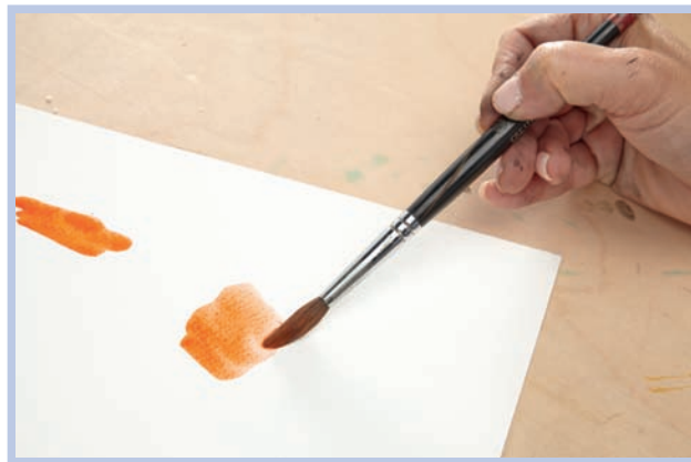
Правильно: горизонтально держать кисточку за среднюю часть ручки.