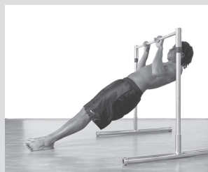
Австралийское подтягивание (см. с. 102)