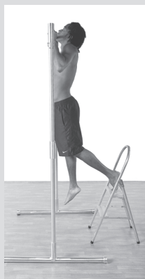
Подтягивание с помощью (см. с. 104)