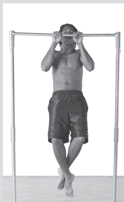
Подтягивание узким хватом (см. с. 39)