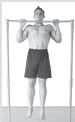
Подтягивание стандартным хватом (см. с. 31)