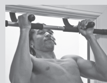
Подтягивание нейтральным хватом (см. с. 38)