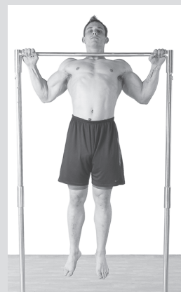
Подтягивание широким хватом (см. с. 40)