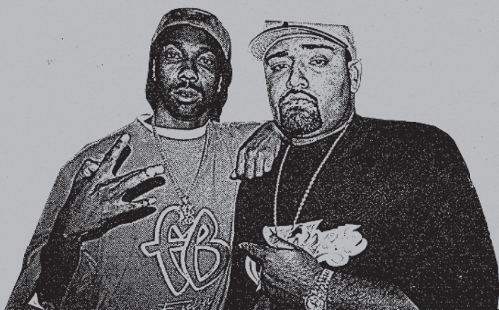
Mc Eiht и Mack 10 на съемках фильма «Thicker Than Water»