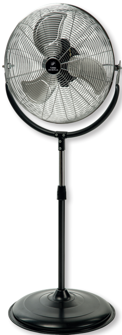
TURBO-455 CN PLUS