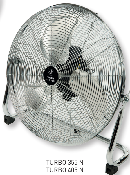
TURBO 355 N TURBO 405 N TURBO 455 N PLUS