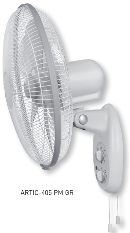
ARTIC-405 PM GR