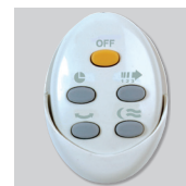
Artic-405 PRC GR Дистанционный пульт управления.