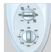
Artic 405 PM GR Переключатель скоростей и таймер.