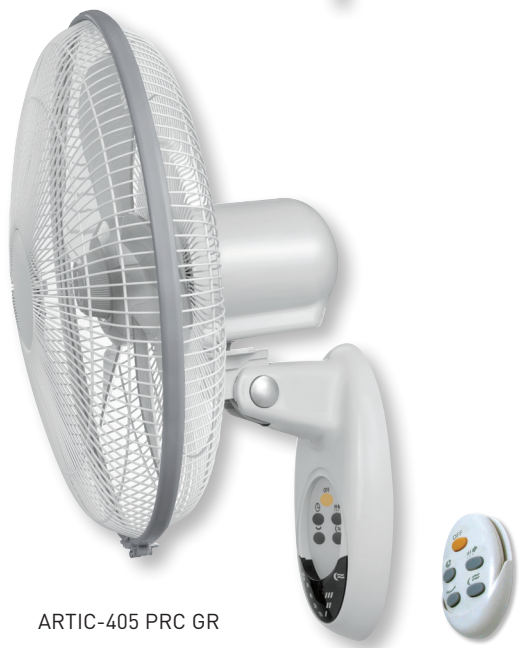
ARTIC-405 PRC GR

Настенные вентиляторы ARTIC PM/PRC GR обладают низким уровнем шума, имеют три скорости вращения и таймер.