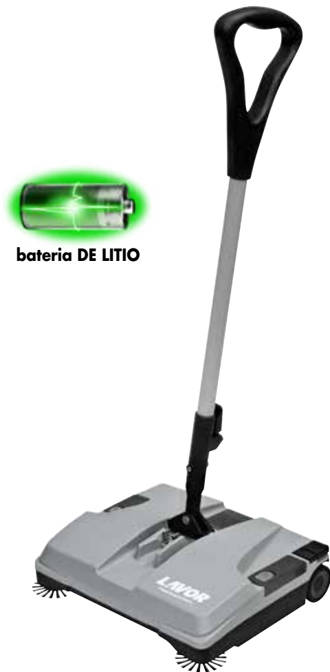
batería DE LITIO