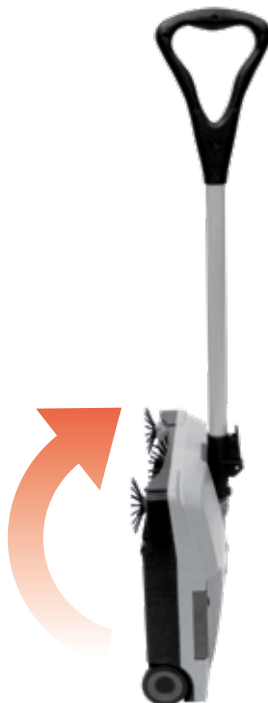
Ahorro de espacio posición de almacenamiento.