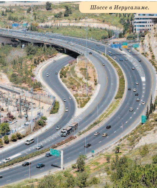
Шоссе в Иерусалиме.

Рельеф Израиля довольно разнообразен. На западе страны, вдоль побережья Средиземного моря, тянется плодородная Прибрежная равнина. Северо-восток Израиля занимают Голанские высоты, восток – горные цепи Галилеи и Самарии, а также впадины Иорданской долины и Мертвого моря. На юге Израиля находятся пустыни Негев и Арава. Самая высокая точка страны – гора Хермон (2224 м) на