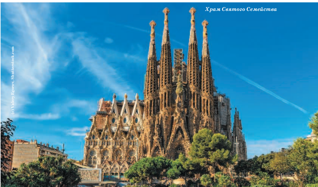
Храм Святого Семейства

Первый камень в фундаменте нового храма был заложен 19 марта 1882 г., и этот день считается датой начала строительства. Согласно первоначальному проекту архитектора Франциско дель Вильяра-и-Лозано (кат. Francisco de Paula del Villar y Lozano ), предполагалось