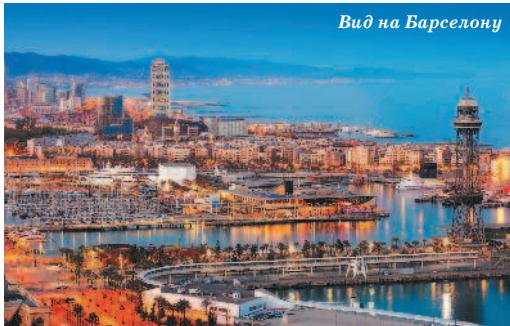
Вид на Барселону

Каталанский — это самостоятельный язык, принадлежащий к языкам романской группы. С кастильским, то есть испанским языком, он имеет много общего, но ближайшим его родственником является провансальский язык в Южной Франции. Первые документы на каталанском языке относятся к XII в. На нем говорят жители Балеарских островов, автономной области Валенсия (его здесь называют валенсийским), в Южной Франции (Перпиньян), в так называемой Франжа (пограничные земли между Каталонией и Арагоном) и на части острова Сардиния (Альгер). Сегодня наряду с испанским он признан в Каталонии государственным. Преподавание в государственных школах и университетах официально ведется на каталанском языке (т. н. «политика